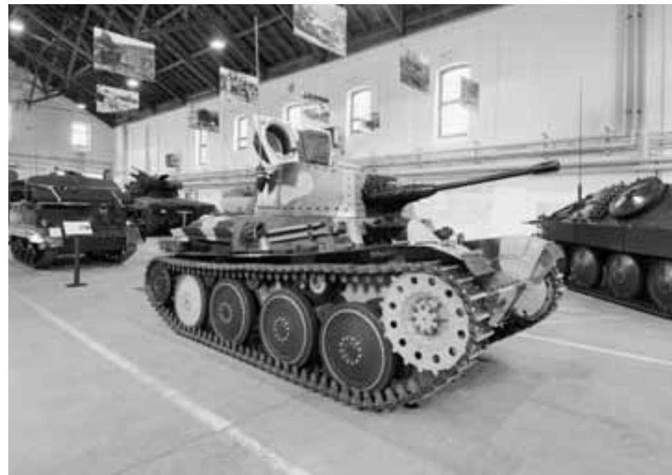
Coup d'oeil dans l'ancienne halle d'équitation de la place d'armes de Thoune – espace aujourd'hui idéal pour abriter la collection de chars.

de la Formation d'application des chars, domiciliée à Thoune. «Il n'empêche que la guerre et les armées constituent depuis toujours un élément du devenir de notre monde, exactement comme la politique, l'économie et la culture.»