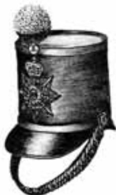
«Pot de beurre»: schako cylindrique; ordonnance cantonale aux environs de 1830