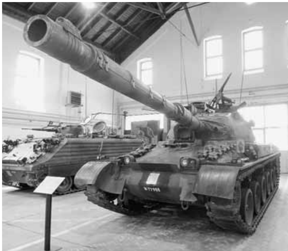
Le char 68 – objet de fierté des constructeurs suisses de chars – est dorénavant présent dans la nouvelle collection à Thoune; la majeure partie de ces véhicules ont toutefois été démolis.