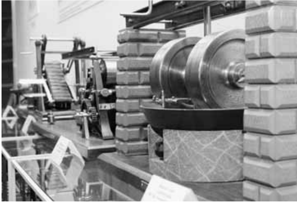
La fabrication de la poudre noire est documentée au moyen de nombreux modèles des rudimentaires machines d'antan.

noire étaient en service sur le territoire actuel de la Confédération, dont un tiers environ sur territoire bernois. Bien qu'il existe des documentations relativement complètes sur ces exploitations en raison du monopole de la poudre que détenaient les cantons – monopole qu'ils allaient ensuite devoir céder à la Confédération, il n'existe pas, jusqu'ici, de vue d'ensemble détaillée et systématique pour la Suisse qui puisse se fonder sur des monographies des différents moulins. Le moulin à poudre de Steffisburg est pour l'instant l'unique exploitation de Suisse dont l'histoire ait fait l'objet d'une étude et d'une documentation complètes.