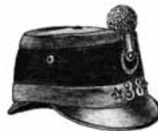
«Shako vetterli»: aussi appelé képi; couvre-chef à l'époque des fusils Vetterli; ordonnance fédérale 1888/98

Mentionnons encore, par exemple, le «chapeau à cadran» de forme cylindrique asymétrique (d'ordonnance dans de nombreux cantons aux environs de 1800) ou, plus tard, «la gamelle» (casque en acier M1918). Et la liste est bien loin d'être exhaustive ...!