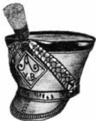
«Plancher de bal»: schako avec couvercle en cuir particulièrement grand; ordonnance cantonale aux environs de 1820

Notons, par ailleurs, que bon nombre de couvre-chefs étaient désignés par des surnoms caractéristiques. En voici quelques exemples: