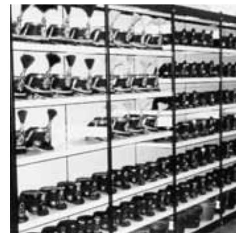
Aperçu de la collection de couvre-chefs de la Vsam à Thoune.

Un collègue collectionneur m'a raconté que, lors de ses expéditions à la recherche de pièces de collection pas trop coûteuses dans les années 50 et 60, il a par exemple vu à plusieurs reprises des shakos vetterli cloués à l'envers au toit de fermes et de granges de l'Emmental, où ils servaient de nids d'hirondelles! Je me souviens aussi du temps où les casquettes rigides galonnées des supérieurs étaient des objets appréciés de blagues les