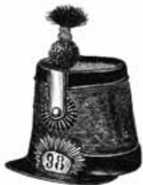
«Schabsiger»: haut schako conique; introduit dans plusieurs cantons à partir de 1830, puis d'ordonnance fédérale à partir de 1852