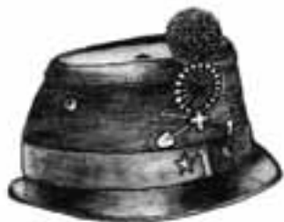
«Shako trottoir» schako conique de faible hauteur avec rebord sur le pourtour; ordonnance fédérale 1869