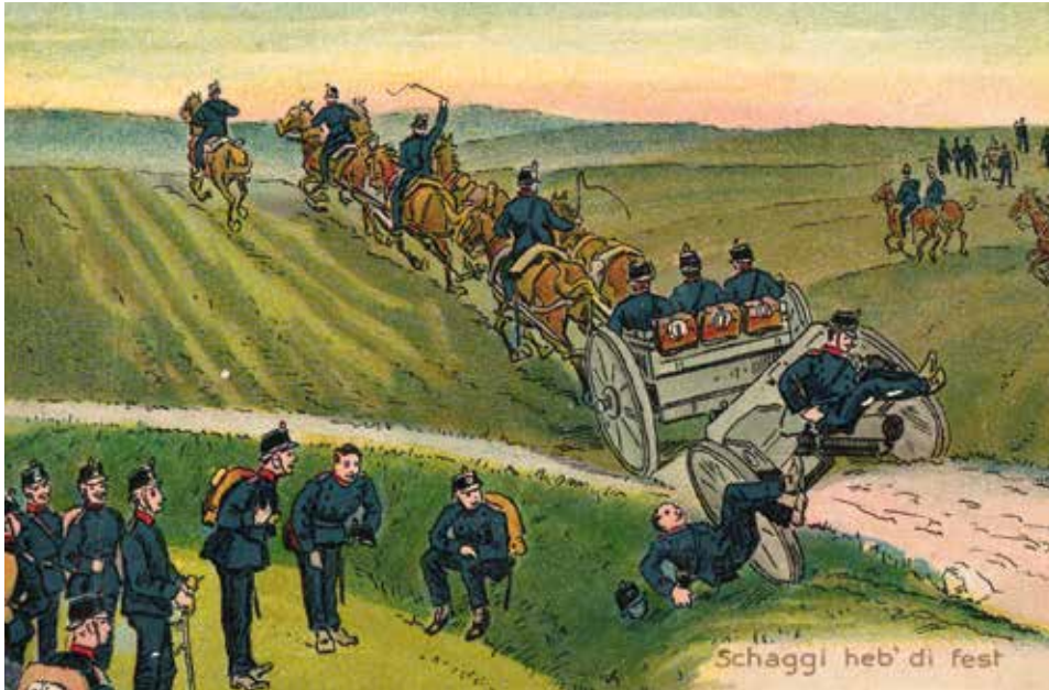
Schaggi tiens toi bien !