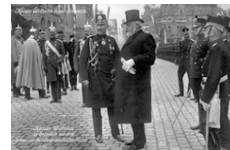
Visite de l'empereur Guillaume II en Suisse en 1912.