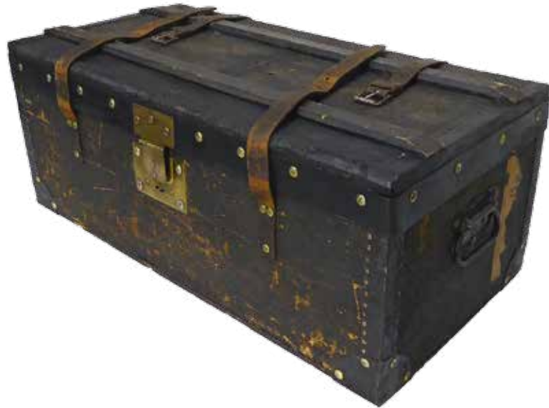
Les cornières et les renforts d'angles ressemblent fortement à la malle d'officier d'ordonnance 1889.

Cette publication de plus de 150 pages richement illustrées est disponible dans le magasin de l'Association du musée suisse de l'armée au prix de 40 francs. La liste complète des publications disponibles peut être consultée sur notre site Internet www.armeemuseum.ch , onglet Boutique.