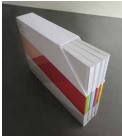
Les quatre tomes sont également disponibles ensemble dans un coffret.

L'édition complète Composée des quatre volumes regroupés dans un coffret pratique, cette édition est disponible au prix avantageux de 79 francs, soit une économie de 11 francs par rapport à l'achat des volumes séparément.