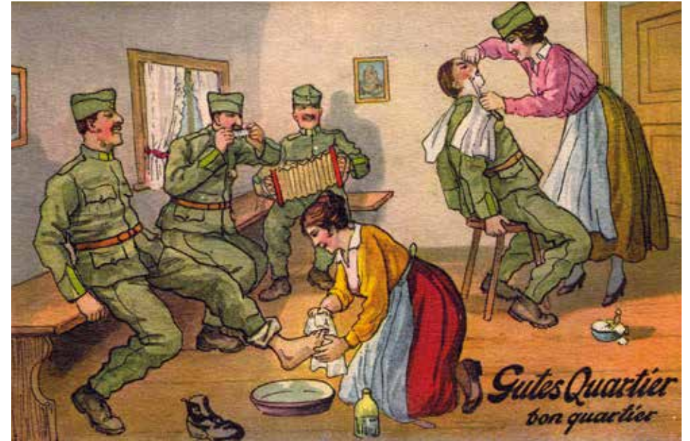
Gutes Quartier. Bon quartier.