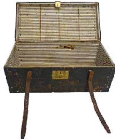
Malle ouverte avec revêtement intérieur en tissu rayé. Aucun aménagement intérieur n'est présent ou prévu.

L'auteur est bien évidemment reconnaissant pour tout renseignement complémentaire sur le modèle de malle présenté et sur des modèles similaires.