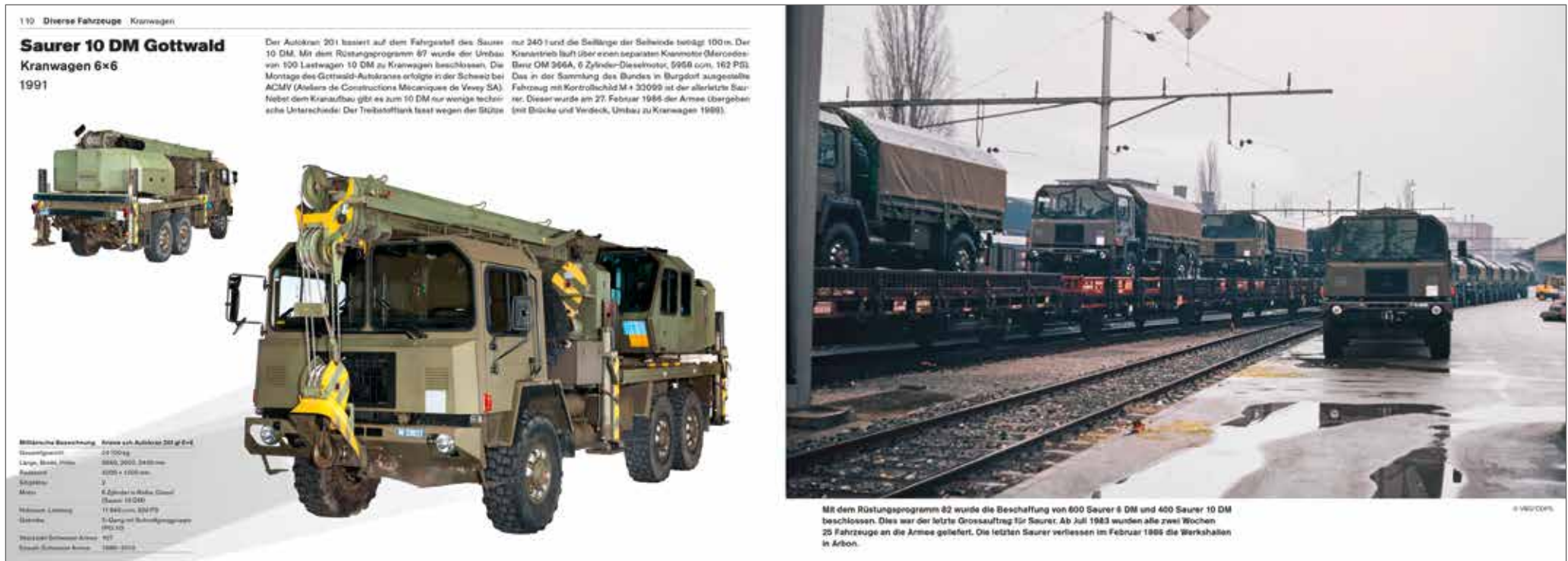
Exemple d'une double page extraite de la série d'ouvrages Historische Armeefahrzeuge (Véhicules historiques de l'armée).