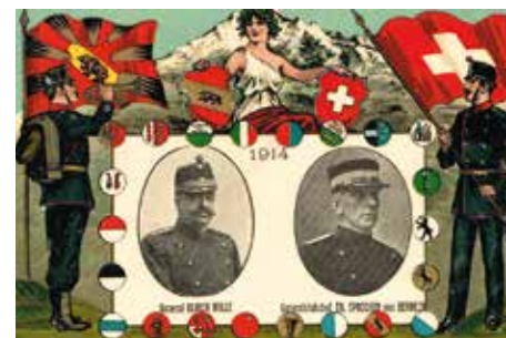
Occupation de la frontière en 1914, avec photos du général et du chef de l'État-major général.