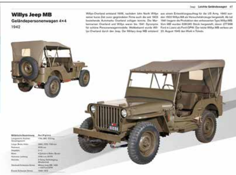
Exemple d'une double page extraite de la série d'ouvrages Historische Armeefahrzeuge (Véhicules historiques de l'armée).

Volume 1 Chars , 72 pages, broché, 280 x 210 mm, prix unitaire 15 francs. Description de tous les chars de la collection de Berthoud, complétée par des photographies historiques, notamment du convoi du premier Centurion en août 1952 et de la livraison des premiers chars de grenadier le 20 août 1964. Volume 2 Véhicules lourds à moteur , 144 pages, prix unitaire 25 francs. Aux photographies sont ajoutées de courtes précisions sur la fonction de chaque véhicule, mais aussi sur l'histoire des différents modèles et de leurs fabricants. L'ouvrage présente également le tout dernier exemplaire de la marque Saurer et le tout dernier FBW, qui font tous deux partie de la collection de Berthoud.