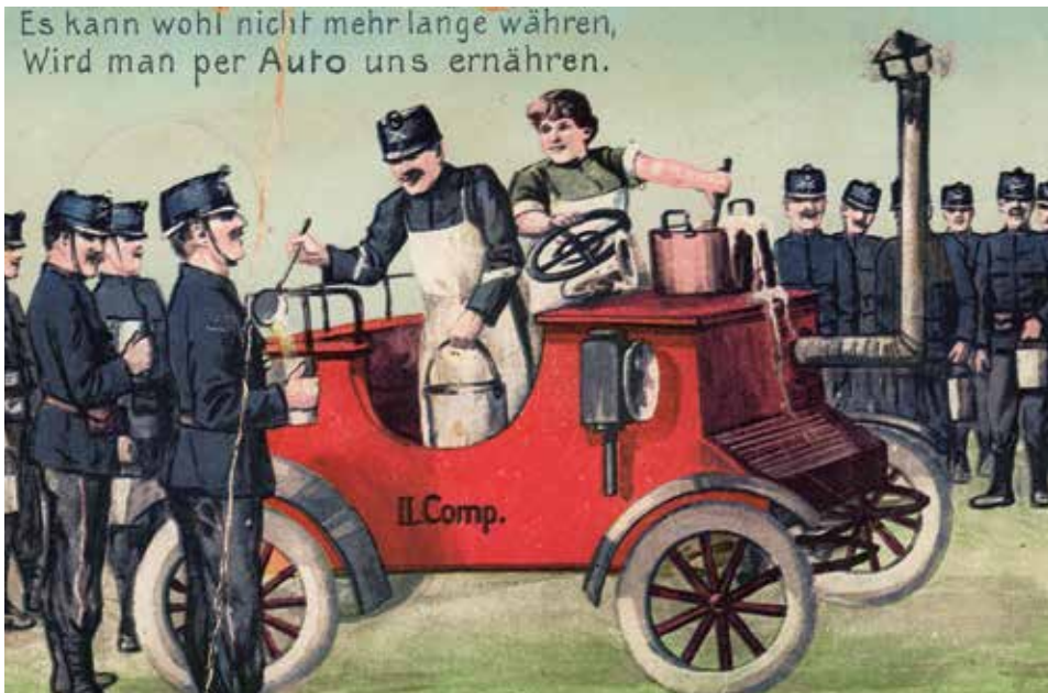
Ça ne pourra plus durer bien longtemps avant que nous ne recevions nos repas par voiture.