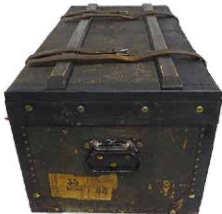
Vue de gauche de la malle, avec poignées similaires au modèle d'ordonnance.