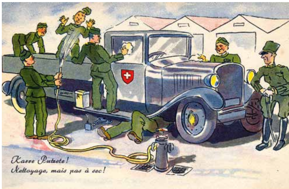
Karre Putzete! Nettoyage, mais pas à sec!