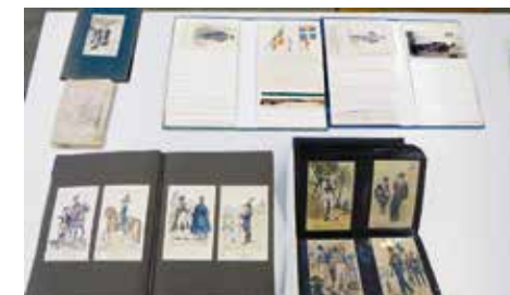
Aperçu de la collection de Peter Mäder, rangée dans des boîtes de classement et en partie dans des albums.